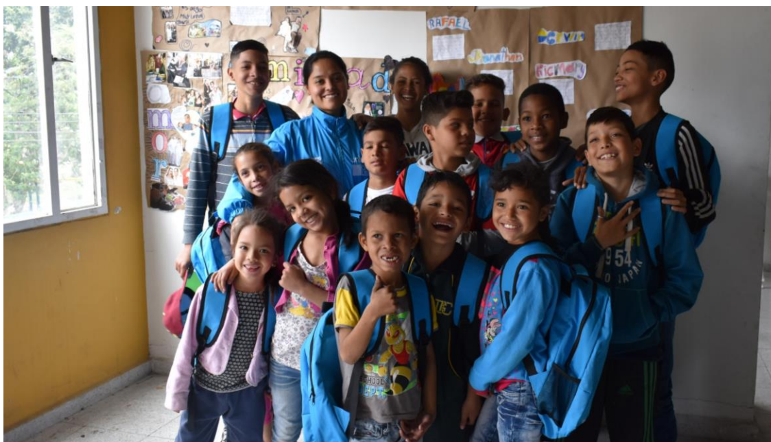
Fotografías referencia de los kits entregados por UNICEF

Gracias a las donaciones de empresas aliadas al propósito educativo se han entregado 8.891 kits escolares adicionales en el año 2019.