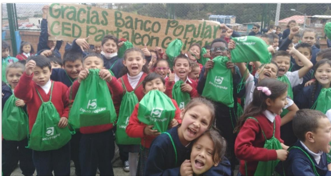
Fotografías referencia de los kits entregados por BANCO POPULAR